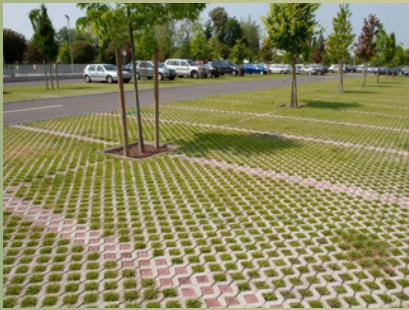
TIPOLOGIA DI PARCHEGGIO