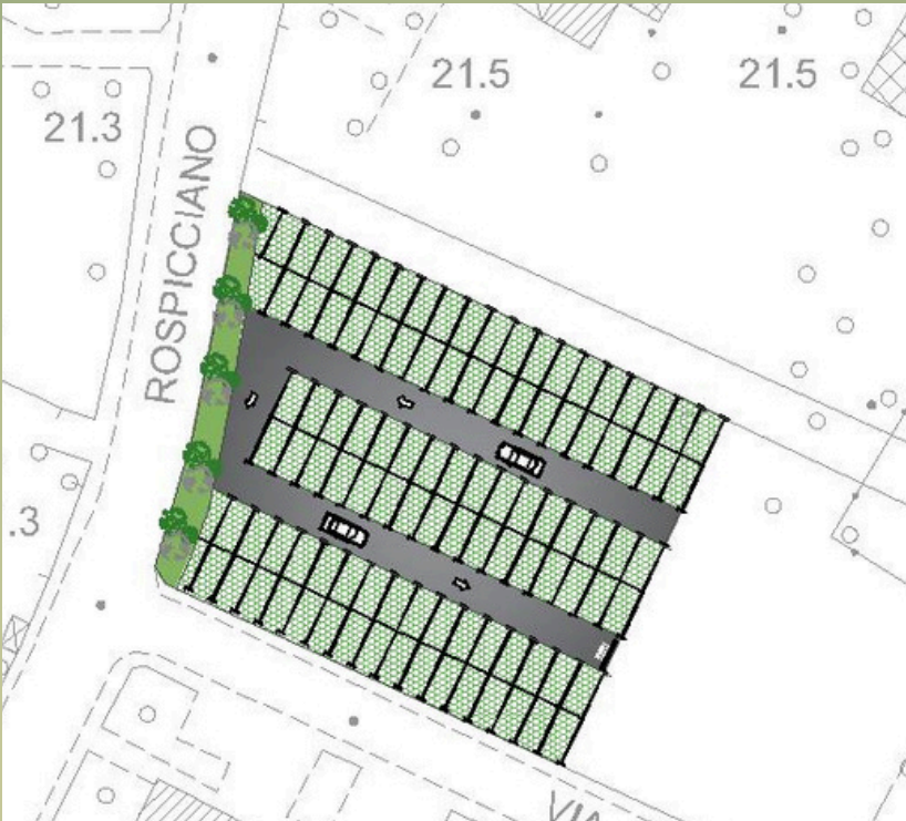
PLANIMETRIA GENERALE POSTI AUTO 109