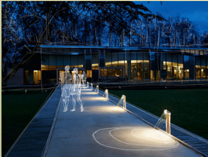
ESEMPIO ILLUMINAZIONE VIA TRIESTE