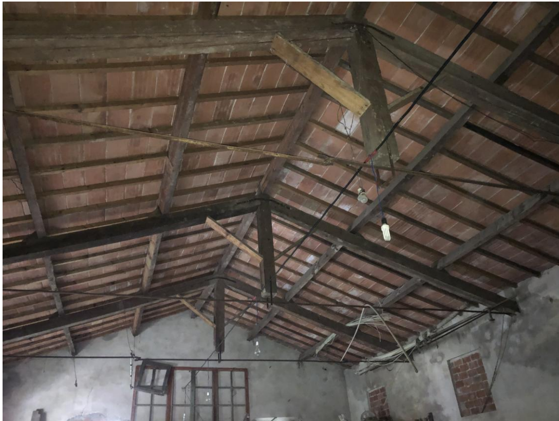
7 - Vista dall'interno della copertura con le capriate