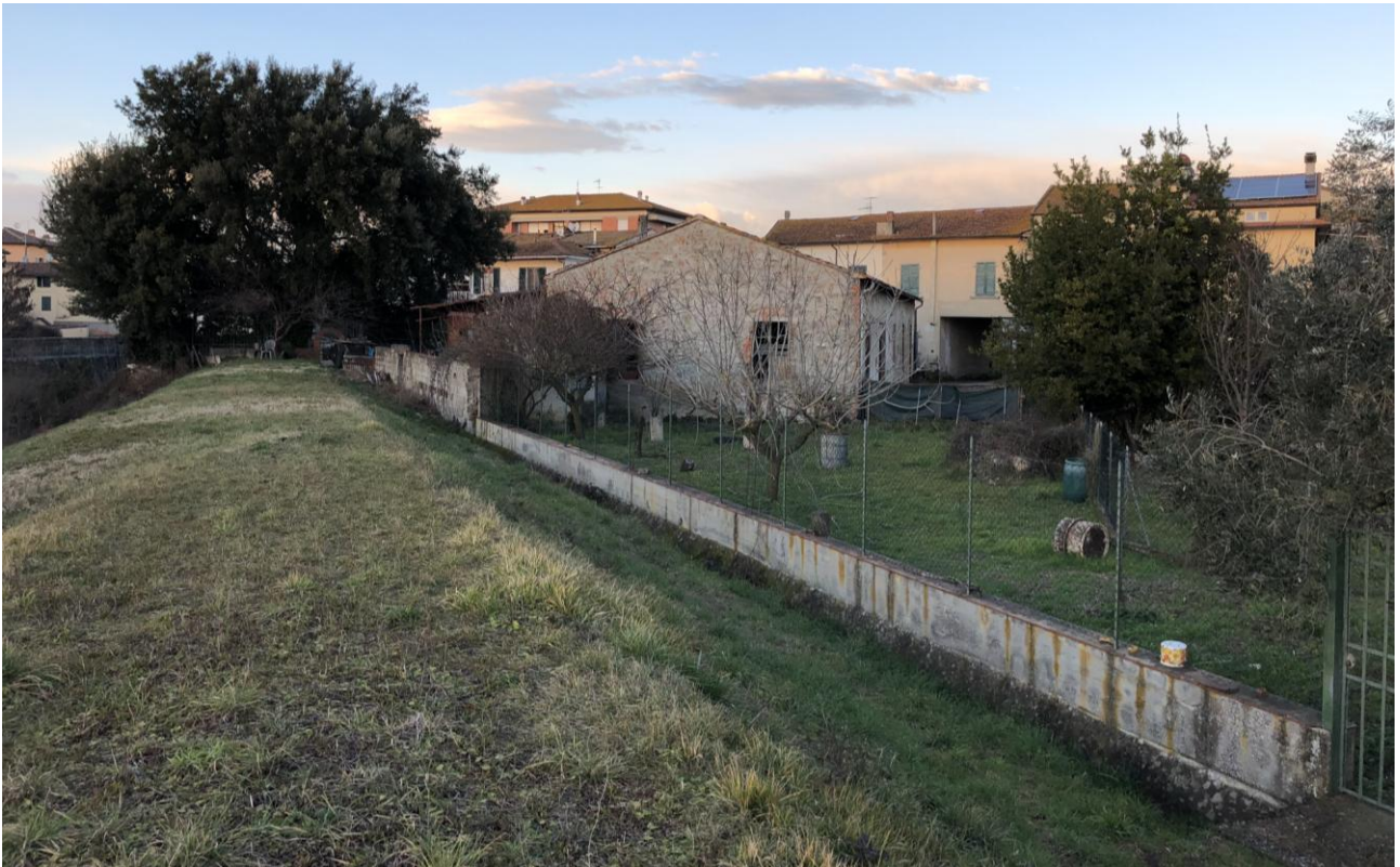
5 - Vista del fabbricato e del terreno da sud (scatto effettuato dall'argine del Cascina)