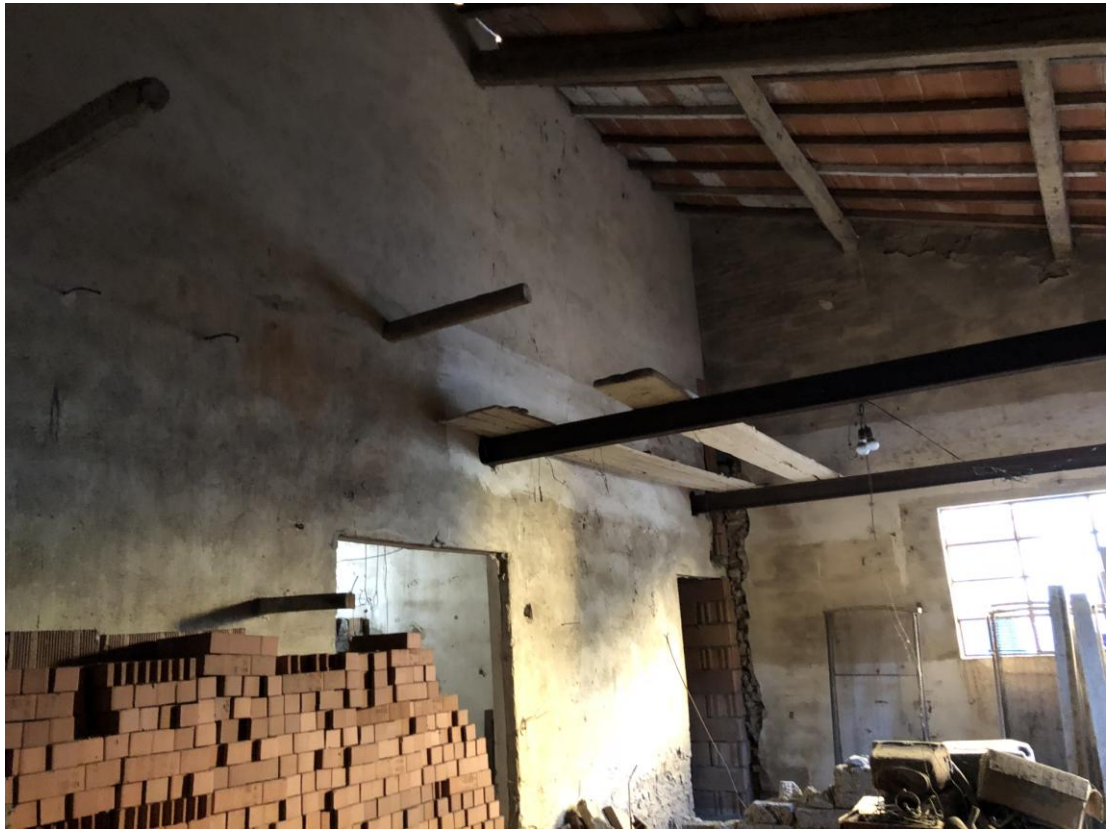
9 - Vista dall'interno della parte nord-est del fabbricato