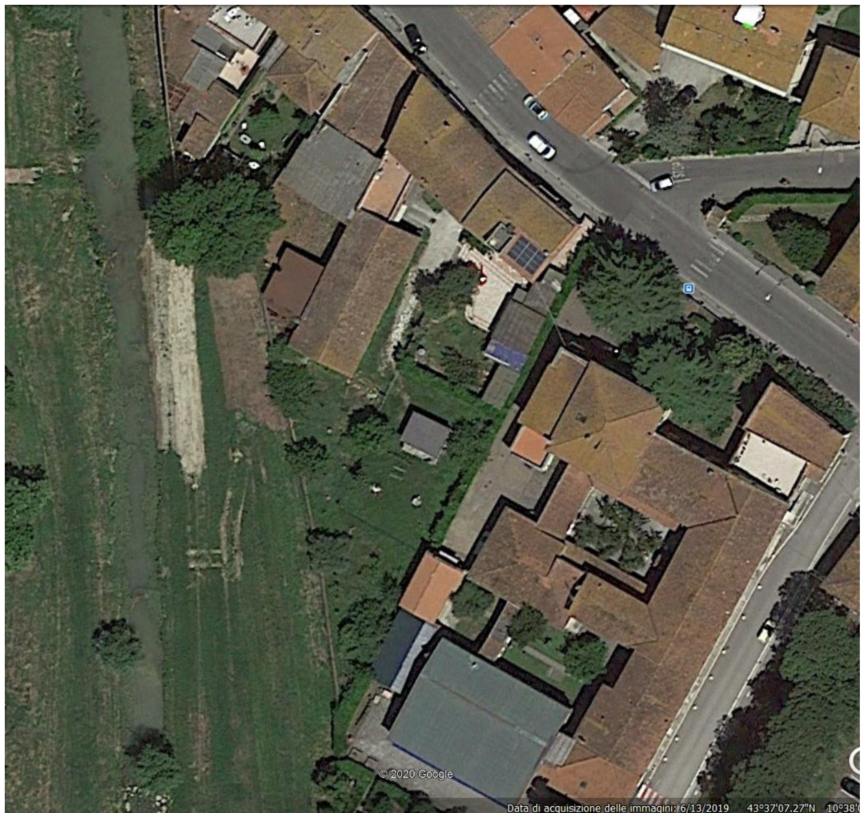
4 - Vista dall'alto (foto dal satellite)