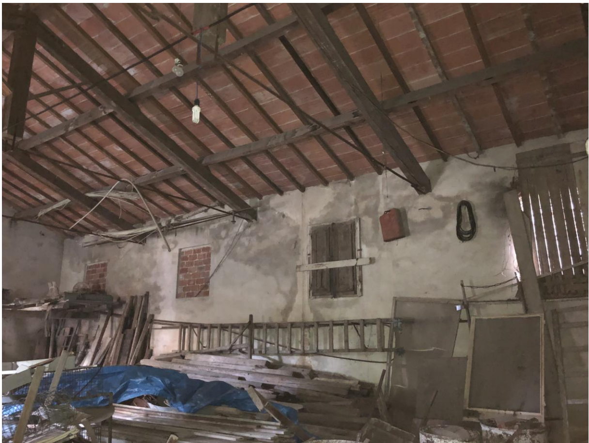
8 - Vista dall'interno della parte da adibire a sala polivalente