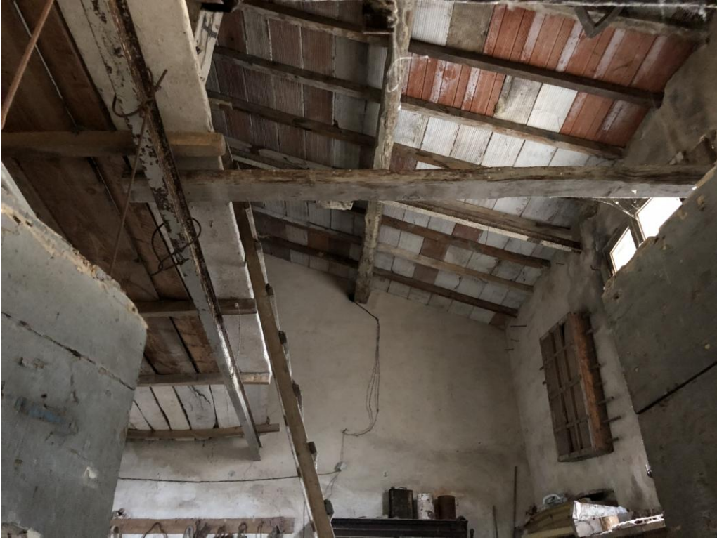
11 - Vista dall'interno della parte nord-ovest del fabbricato