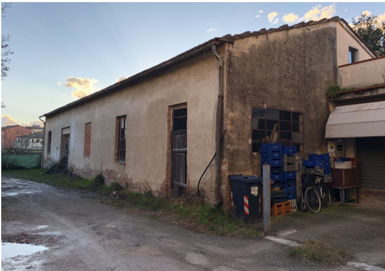
1 - Vista del fabbricato da nord-est (scatto effettuato dalla strada privata interna, in prossimità del sottopassaggio di accesso all'area)

I punti di scatto delle foto sono indicati nella Tavola n.1