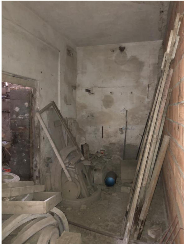
12 - Vista dall'interno dell'angolo nord-ovest del fabbricato