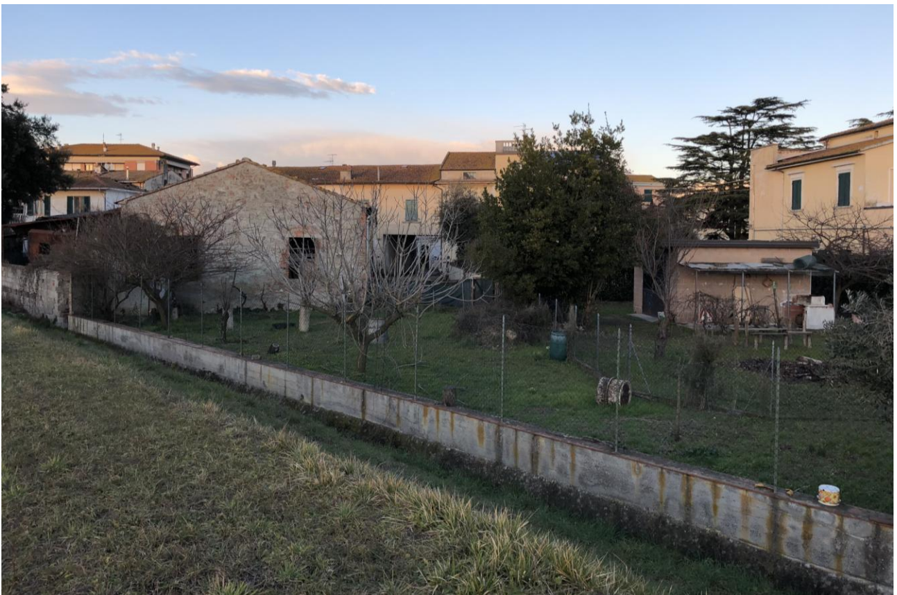
6 - Vista del fabbricato e del terreno da sud-ovest (scatto effettuato dall'argine del Cascina)