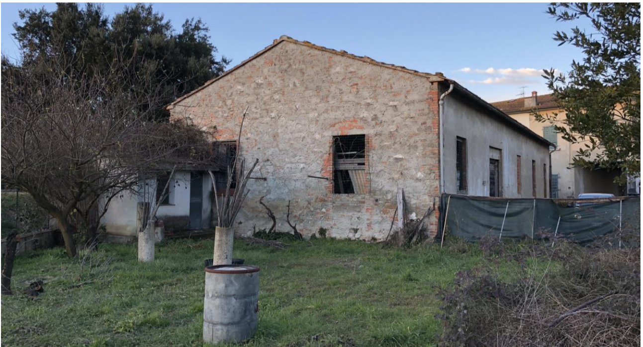
3 - Vista del fabbricato da sud (scatto effettuato dal terreno di proprietà esclusiva del comparto 110 a)