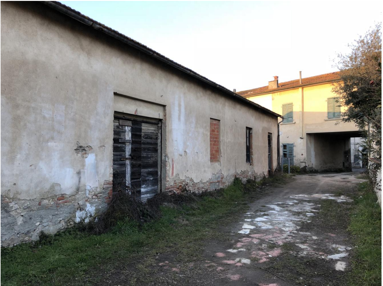
2 - Vista del fabbricato da sud-est (scatto effettuato dalla strada privata interna)