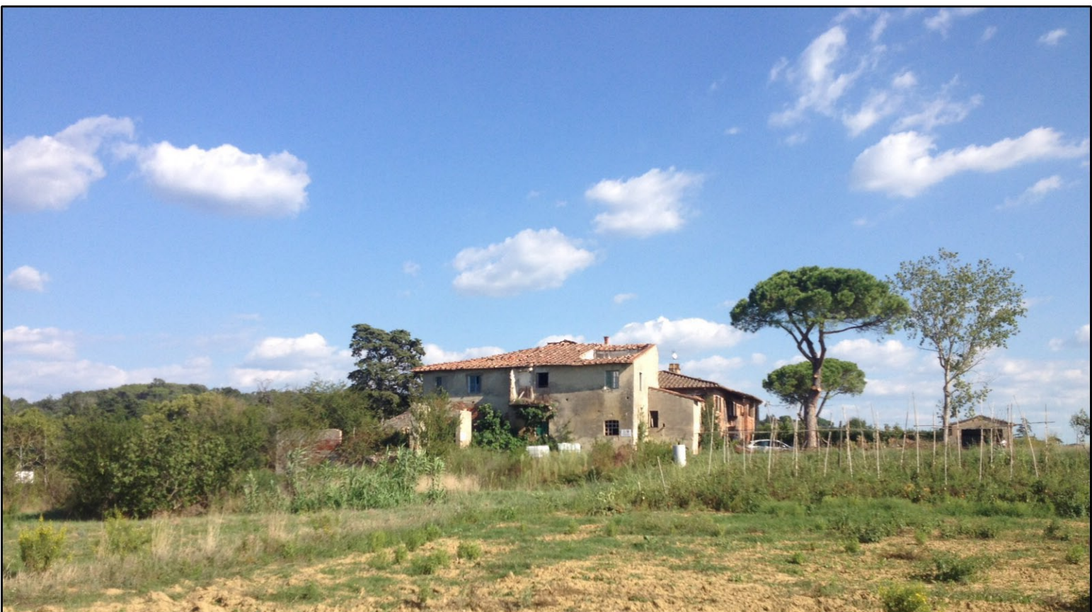
Foto n. 01 - vista dell'Unità Minima di Intervento 1, da Nord Ovest