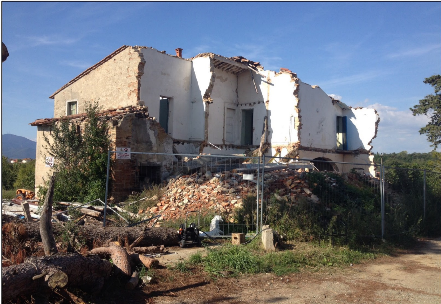
Foto n. 05 - vista dell'Unità Minima di intervento n. 1 da Est