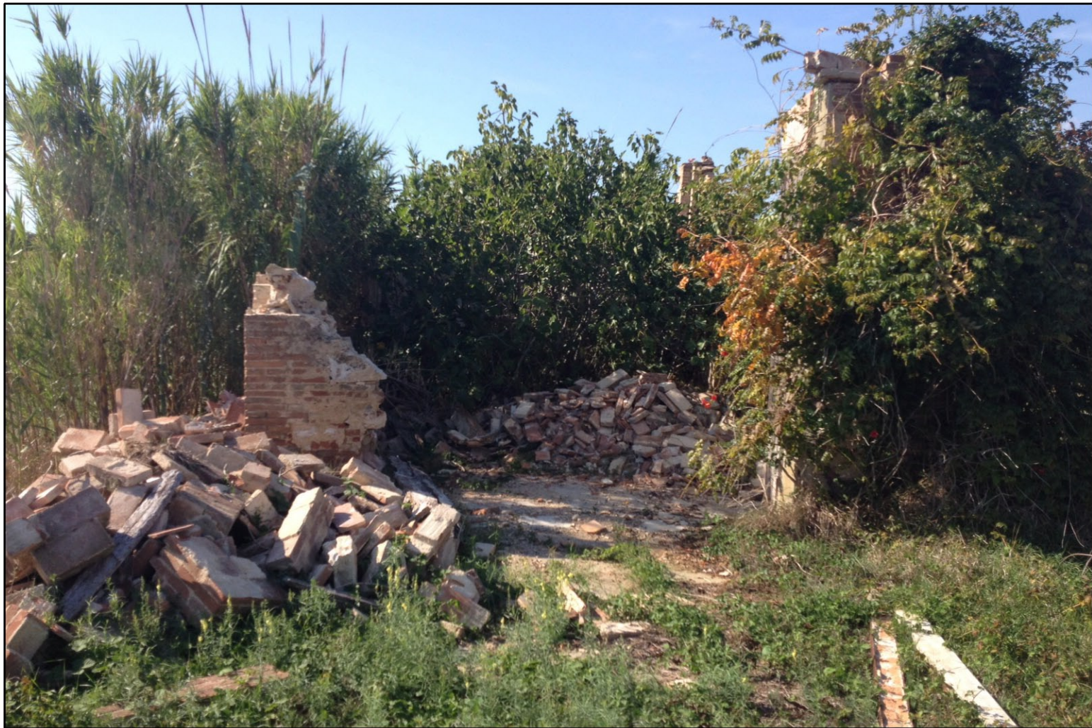
Foto n. 04 - vista di dettaglio del piccolo annesso