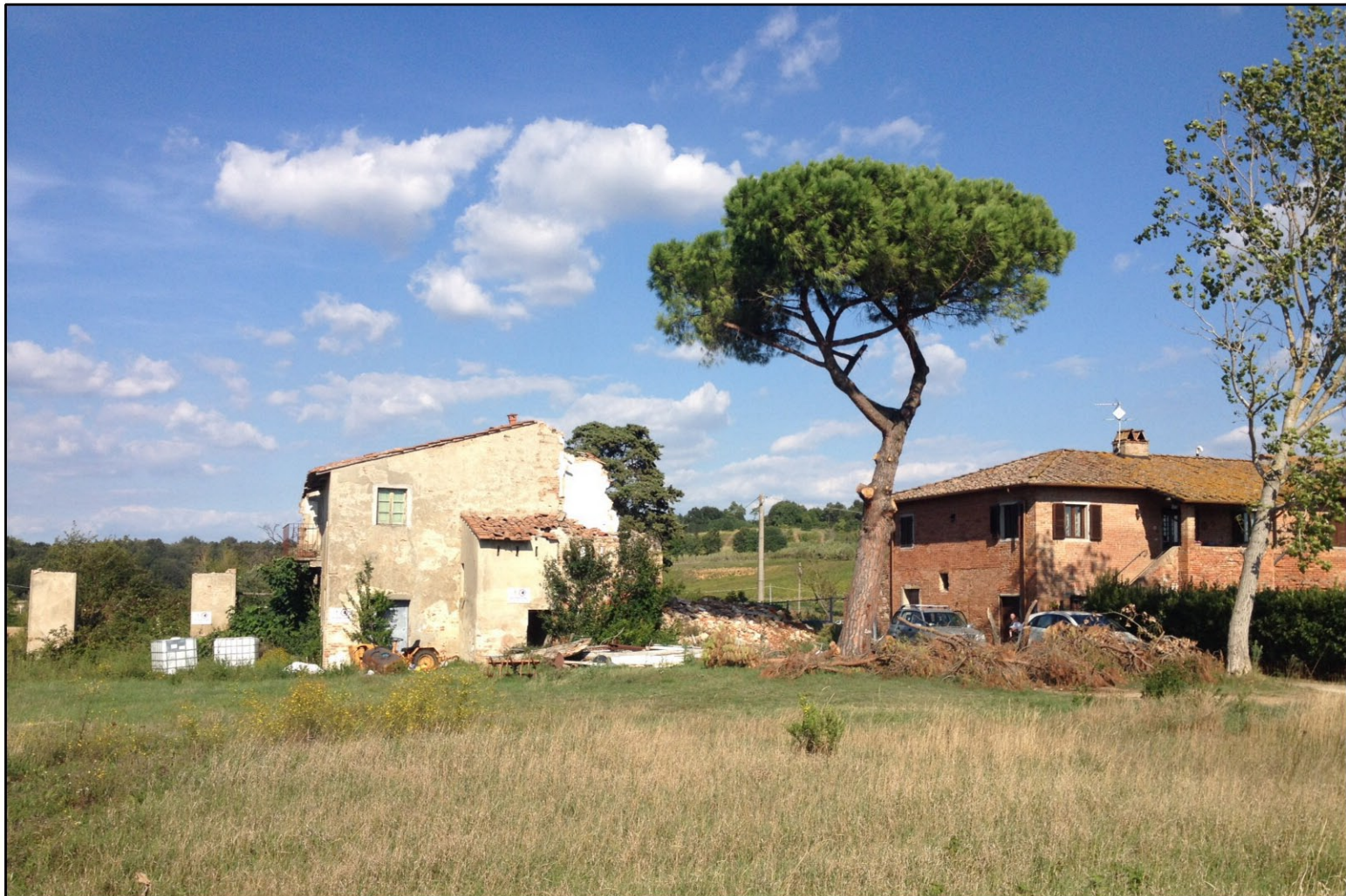
Foto n. 02 - Vista dell'Unità Minima di Intervento 1, da Sud Ovest