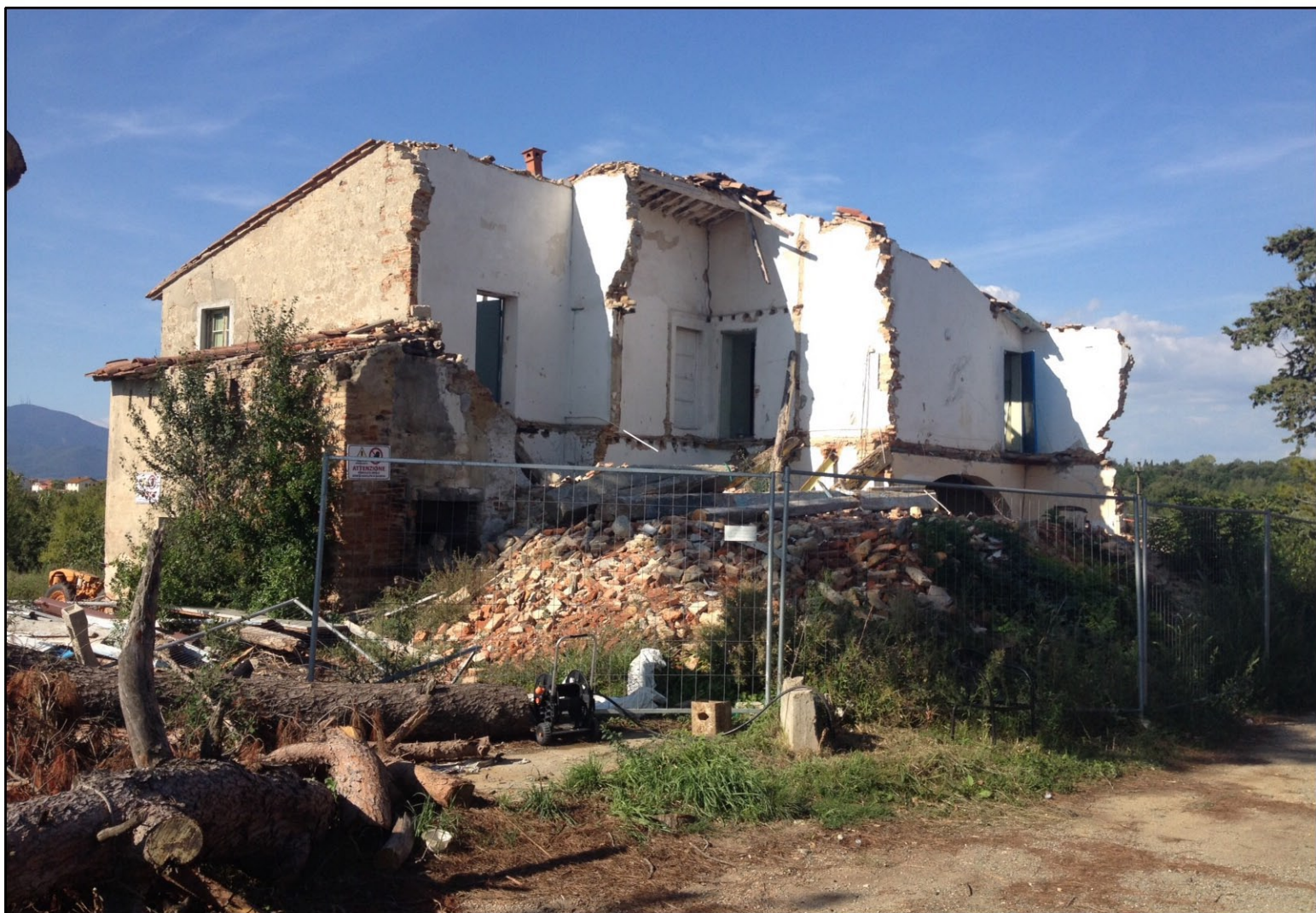
Foto n. 03 - Vista dell'unità Minina di Intervento 1, vista da Sud Est